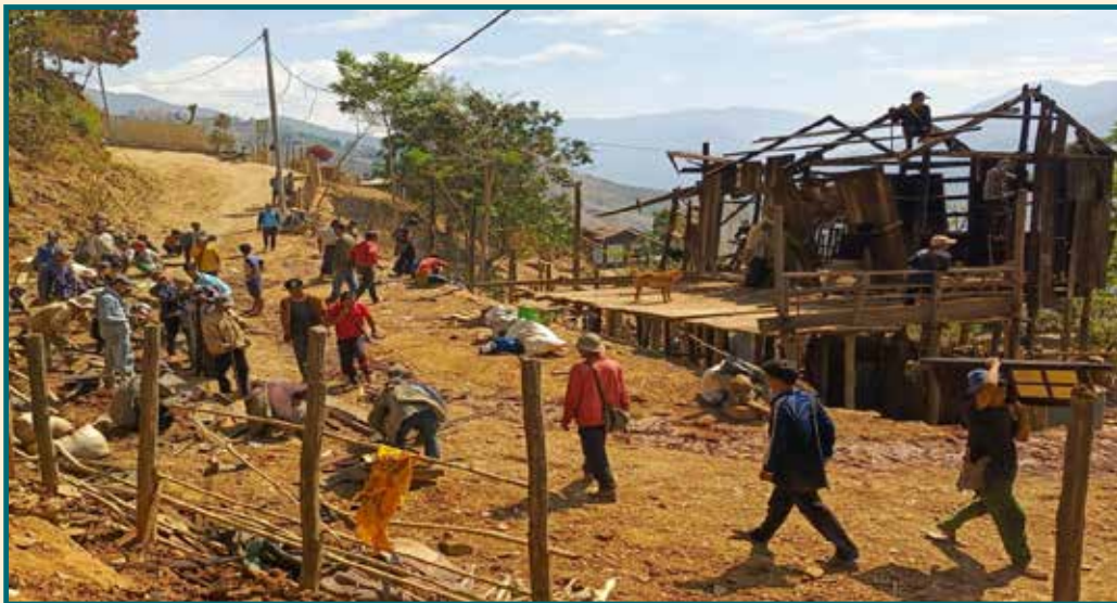
၂၀၂၅ ခုနှစ်၊ ဧပြီလ ၉ ရက်နေ့တွင် ချင်းပြည်နယ်မြောက်ပိုင်း၊ တီးတိမ်မြို့နယ်ရှိ ဆိုင်ဇန်ရွာကို ဗုံးကြဲတိုက်ခိုက်မှုကြောင့် အိမ်များပျက်စီးသွားခဲ့ပုံ။

ထိုဖြစ်ရပ်သည် လေကြောင်းတိုက်ခိုက်မှုများကြောင့် အရပ်သားများ၊ အထူးသဖြင့် ကလေးများပင် ထိခိုက်သေဆုံးနေကြောင်းကို ထပ်မံပြသသည့် ဖြစ်ရပ်တခု ဖြစ်သည်။