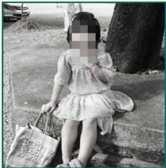
၂၀၂၅ ခုနှစ် ဇွန်လ ၁၂ ရက်နေ့တွင် မြန်မာစစ်တပ်မှ ပစ်ခတ်လိုက်သည့် လက်နက်ကြီးသည် ကရင်ပြည်နယ်၊ ကော့ကရိတ်မြို့နယ်၊ ကော့ဘောကျေးရွာတွင် ပွဲတော်ကျင်းပနေသည့် အရပ်သားအိမ်တစ်လုံးကို ထိမှန်ခဲ့ပြီး ကလေးနှစ်ဦး အပါအဝင် အရပ်သား ခုနှစ်ဦးသေဆုံးခဲ့သည်။