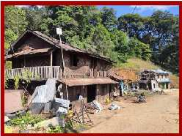
နမ့်ခမ်းမြို့ ညဈေးအနီးတွင် လေယာဉ်ခုံးကြောင့် မိသားစုလိုက် သေဆုံးမှုပုံ