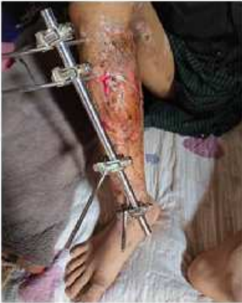
မိုင်းရှင်းလင်းရေး လုပ်ဆောင်စဉ် ဒဏ်ရာရရှိပုံ

အဆိုပါဖြစ်စဉ်ကို ကလေးအမေဖြစ်သူက "သူက ဟူးမွန်ဆည်ဘက်မှာ စစ်ကောင်စီထောင်ထားတဲ့ မိုင်းတွေ လိုက်ဖြုတ်နေတာ၊ ဖြုတ်ထားတဲ့ မိုင်းအားလုံးကိုလည်း အိမ်အထိ သယ်လာခဲ့တယ်။ ဖြုတ်လာတဲ့ မိုင်းထဲက တစ်လုံးကို သူ့ရဲ့ သူငယ်ချင်းတွေမြင်အောင်လို့ မိုင်းကို လက်နှစ်ဖက်နဲ့ ရိုက်နေချိန်မှာ မိုင်းက ပေါက်ကွဲသွားလို့ သူနဲ့ ကလေးခုသုံးယောက်လဲ ဒဏ်ရာရကြတယ်။ သူကတော့ ဒဏ်ရာ ပြင်း ထန်တယ် လက်နှစ်ဖက် ဖြတ်ရတဲ့အထိ ဖြစ်တယ် "ဟု ပြောပြခဲ့သည်။