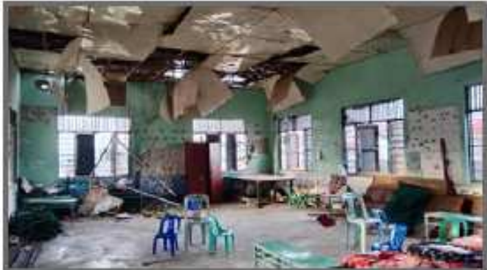
မူဆယ်မြို့နယ် မန်မော်ရွာ စာသင်ကျောင်း ထိခိုက်ပျက်စီး ပုံ