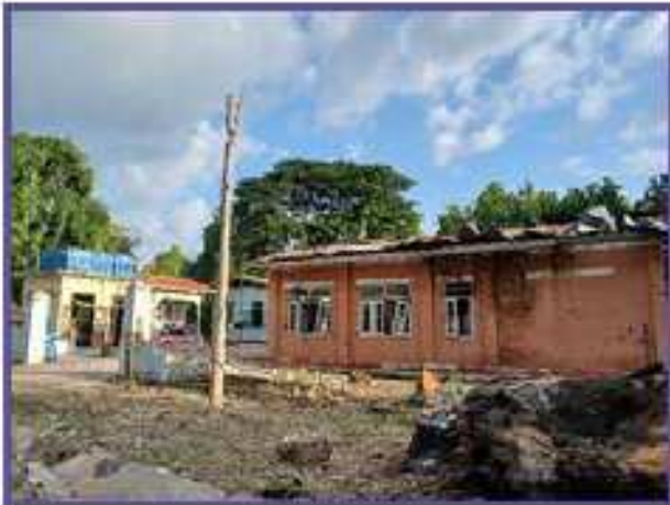
မိုးမိတ်ဆေးရုံ လက်နက်ကြီး ထိခိုက်မှု ပုံ

ထိုနောက် တိုက်ပွဲများဖြစ်ပွားခြင်း မရှိဘဲ အကြမ်းဖက်ခစ်ကောင်စီသည် လေယာဉ်အသုံးပြုကာ စာသင်ကျောင်း၊ ဆေးရုံ၊ ဆေးပေးခန်းများကို ရည်ရွယ်ချက်ရှိရှိဖြင့် ဗုံးကြဲတိုက်ခိုက်မှုကြောင့် စာသင်ကျောင်း (၁၂)ကျောင်းနှင့် ဆေးရုံ/ဆေးပေးခန်း (၆)နေရာ ထိခိုက်ပျက်စီးမှု ရှိကြောင်း မှတ်တမ်း တင်ထားသည်။