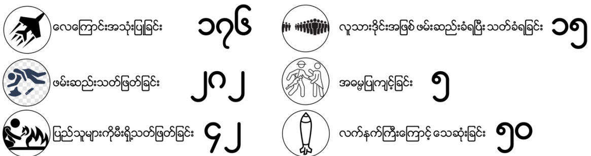
Figure - 2

Spring Archive မှ Social Media မှ သတင်းများကို အခြေခံ၍ ပြုစုထားသည်