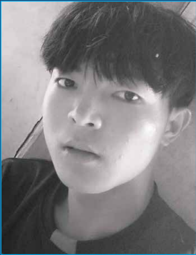
မောင်ရှားရယ်၊ ဖရူဆိုမြို့နယ်၊ လောဂျာကျေးရွာတွင် ၂၀၂၁ ခုနှစ် ဒီဇင်ဘာလ ၂၄ ရက်နေ့ မီးရှို့သတ်ဖြတ်ခံခဲ့ရ သည်။

ဆက်ပြီးပြောရာမှာ “ခုအချိန်မှာ ဘယ်နေရာ မှာပဲနေနေ လုံခြုံမှုမရှိဘူးလို့ ခံစားရတယ်။ မီးရှို့ သတ်ဖြတ်ခံရတာနဲ့ ပတ်သက်ပြီးတော့ တရားမျှတမှု အခြေအနေက ဘာမှမထူးပါဘူး။ အစတုန်းကတော့ ကယားပြည်နယ် သတင်းရဲ့တပ်ဖွဲ့ KYSP က စုံစမ်းမှု တွေ၊ လုပ်ဆောင်မှုတွေ တချို့ရှိခဲ့ပေမယ့် အခုတော့ ဘာ သတင်းမှ မကြားတော့ဘူး။ ဆက်လက်လုပ်ဆောင်နေ သလား၊ မလုပ်ဆောင်နေဘူးလားဆိုတာ ကျွန်မ မသိရ ပါဘူး။ မိသားစုဝင်တွေအားလုံးက စစ်ဘေးရှောင်စခန်း မှာပဲ နေကြရတယ်။ နောက်လကျရင်တော့ အဖေရဲ့ ကျန်းမာရေးအခြေအနေကြည့်ပြီး အဆင်ပြေရင် ထိုင်း နိုင်ငံက ဒုက္ခသည်စခန်းဖက်ကိုသွားဖို့ စိတ်ကူးထား တယ်။ သက်ဆိုင်ရာ တာဝန်ရှိသူတွေဖက်မှ တတ်နိုင် ရင်တော့ ကျွန်မတို့ မိသားစုကို လုံခြုံတဲ့နိုင်ငံကို ပို့ပေး ရင်ကောင်းမယ်။ ကျမကလည်း ကျန်းမာရေးဌာနကနေ CDM လုပ်ထားတော့ ပြည်ပထွက်ဖို့ကတော့ အဆင်မပြေ