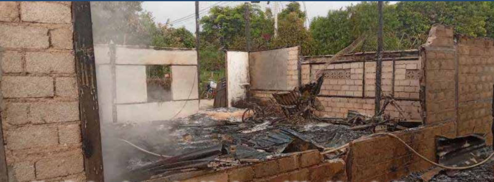
လွိုင်ကော်မြို့နယ်၊ နွားလဗိုးကျေးရွာအုပ်စု၊ မော်ချီးစုစည်းကျေးရွာတွင် မီးရှို့ ဖျက်ဆီးခံရသည့်နေအိမ်အား ၁၈.၉.၂၀၂၂ တွင်တွေ့မြင်ရစဉ်။ (ဒေသခံမှ ပေးပို့သည်)

“ဖမ်းဆီးခေါ် ဆောင်သွားတဲ့နေရာကို အစကမသိရဘူး။ ပြန်လွတ်လာတဲ့အခါမှာ ဒ.က.စ မှာဆိုတာ သိရတယ်။ အဲဒီမှာတော့ ကောင်းကောင်း စစ်ဆေးမေးမြန်းကြတယ်။ စစ်ဆေးမေးမြန်းရင်း PDF တွေနဲ့တ ကယ်ပတ်သက်မှု မရှိမှန်းသိလို့ ပြန်လွတ်ပေးခဲ့တာဖြစ်တယ်။ ဒ.က.စ မှာ တည စစ်ဆေးမေးမြန်းပြီး နောက်တနေ့ ပြန်လွတ်လာတော့ အိမ်မီးရှို့ခံရတာသိရတယ်။ အိမ်မီးရှို့ခံလိုက်ရတာက ၁၈.၉.၂၀၂၂ ညနေပိုင်းကတည်းက ဖြစ်တယ်။ အိမ်မီးရှို့ခံလိုက်ရတာကြောင့် ဘာဆိုဘာတစ်ခုမှ မကျန်တော့ပါဘူး။ အခုတော့ နေစရာအိမ်မရှိတော့လို့ အမျိုးအိမ်မှာ ခေတ္တခိုလို့ နေထိုင်နေရပါတယ်။ အိမ်မရှိတော့လို့ အဖဆို အရမ်းဝမ်းနည်းပြီး စိတ်ဒဏ်ရာရနေတယ်” ဟုပြောပြခဲ့သည်။