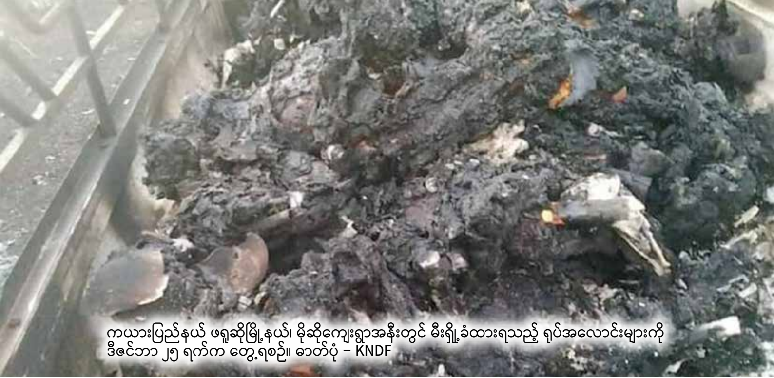
ကယားပြည်နယ် ဖရူဆိုမြို့နယ်၊ မိုဆိုကျေးရွာအနီးတွင် မီးရှို့ခံထားရသည့် ရုပ်အလောင်းများကို ဒီဇင်ဘာ ၂၅ ရက်က တွေ့ရစဉ်။

ဆန်စွာ ညှင်းပန်းနှိပ်စက်မှု၊ မတရားဖမ်းဆီးမှု၊ နေအိမ်များ မီးရှို့မှု၊ လေကြောင်းဖြင့်ဗုံးကျဲတိုက်ခိုက်မှုနှင့် လိုက်အပြု လိုက်ကို သပြေလိုက်သတ်ဖြတ်မှု စသည်လူ့အခွင့်အရေး ချိုးဖောက်မှုများနှင့် စစ်ရာဇဝတ်မှုများကို နိုင်ငံအဝန်း၌ အထိန်းအကွပ်မရှိ လွတ်လပ်စွာ ကျူးလွန်နေသည်မှာ အားလုံးအသိပင်ဖြစ်သည်။