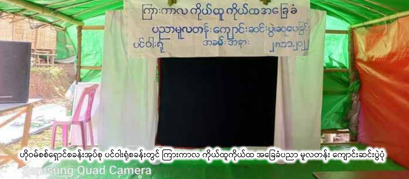
ဟိုဝမ်စစ်ရှောင်စခန်းအုပ်စု ပင်ဝါးရုံစခန်းတွင် ကြားကာလ ကိုယ်ထူကိုယ်ထ အခြေခံပညာ မူလတန်း ကျောင်းဆင်းပွဲပုံ