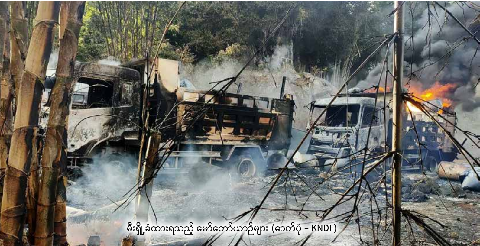
မီးရှို့ခံထားရသည့် မော်တော်ယာဉ်များ

အကြမ်းဖက်စစ်တပ်၏ လေကြောင်းအားကိုးပြီး ပရမ်းပတာထိုးစစ်ဆင် ပစ်ခတ်တိုက်ခိုက်မှု များကြောင့် ကယား (ကရင်နီ) ပြည်နယ်တွင် လူနေအိမ်များ၊ ဈေးဆိုင် များ၊ လမ်းတံတားများနှင့် ဘာသာရေးအဆောက် အဦး များ ပျက်ဆီးဆုံးရှုံးခဲ့ရပြီး ပြည်သူ့ အများအပြားသည် လည်း ထိခိုက်သေကျေခဲ့ရသကဲ့သို့၊ စစ်ဘေးရှောင် ပြည် သူများလည်း တရက်ပြီးတရက် တိုးပွားလာနေပါသည်။ ထို့အပြင် ပြည်သူများ၏ ကျန်းမာရေး၊ ပညာရေး၊ စီးပွား ရေး စသည့် ကဏ္ဍများသည်လည်း ထိခိုက်ဆုံးရှုံးကြရ သည်။ ပြည်သူလူထုအပေါ် ပစ်မှတ်ထားပြီး မင်းမဲ့စရိုက်