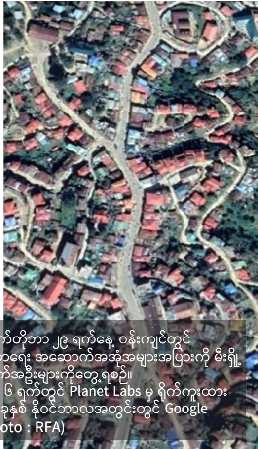
ချင်းပြည်နယ်၊ ထန်တလန်မြို့နယ်တွင် အောက်တိုဘာ ၂၉ ရက်နေ့ ဝန်းကျင်တွင် အကြမ်းဖက်စစ်တပ်မှ နေအိမ်များနှင့် ဘာသာရေး အဆောက်အအုံအများအပြားကို မီးရှို့ ဖျက်ဆီးမှုကြောင့် ပျက်ဆီးနေသော အဆောက်အအုံများကိုတွေ့ရစဉ်။ ဘယ်ဘက်မှ ရုပ်ပုံသည် ၂၀၂၁ ခုနှစ် နိုဝင်ဘာ ၆ ရက်တွင် Planet Labs မှ ရိုက်ကူးထား သည့် ပုံဖြစ်ပြီး ညာဘက်မှ ရုပ်ပုံသည် ၂၀၂၀ ခုနှစ် နိုဝင်ဘာလအတွင်းတွင် Google Earth မှ ရိုက်ကူးထားသည့် ပုံဖြစ်သည်။

နေသည့် ရုပ်အလောင်းသည် အောက်တိုဘာ ၂၄ ရက် နေ့တွင် စစ်အာဏာရှင်တပ်ဖွဲ့များ၏ ဖမ်းဆီးခြင်း ခံရကာ ပေါ်တာအဖြစ် စေခိုင်းခံရသည့် လူငယ်တဦး ဖြစ်ကြောင်း ဖော်ထုတ်နိုင်ခဲ့သည်။ ၂၆ ။ ဓားစာခံများအား သတ်ဖြတ်ခြင်း သည် ဥပဒေပါ ပြဋ္ဌာန်းချက်များကို ဖောက်ဖျက်ကျူးလွန် သည့်အတွက် စစ်ရာဇဝတ်မှုအဖြစ် မှတ်ယူရမည် ဖြစ်သည်။ ထို့အပြင် စစ်အာဏာရှင်တို့၏ အဖျက်လုပ်ရပ် များအဖြစ် ၂၀၂၁ ခုနှစ် အောက်တိုဘာလကုန်တွင် ချင်းပြည်နယ် ထန်တလန်ရှိ အိမ်ခြေ ၂၀၀ နီးပါးနှင့် ဘုရားကျောင်း ၂ ကျောင်းကို မီးရှို့ဖျက်ဆီးခံခဲ့ရသည်။ ရွာသားများမှ ၎င်းတို့ပိုင်ဆိုင်သည့် ပစ္စည်းဥစ္စာနှင့် အိမ်