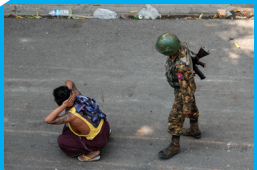
မန္တလေး အာဏာရှင်ဆန္ဒပြပွဲ အတွင်း ဖမ်းဆီးခံထားရသည့် အမျိုးသားတစ်ဦး၏ဘေးတွင် ရပ်နေသောစစ်သားတစ်ဦး အားတွေ့ရစဉ်"