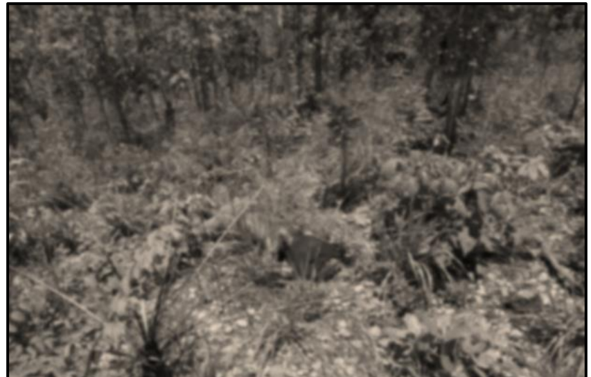
ပုံ (၂-၅) ဒုတိယအကြိမ်ဖြစ်စဉ်