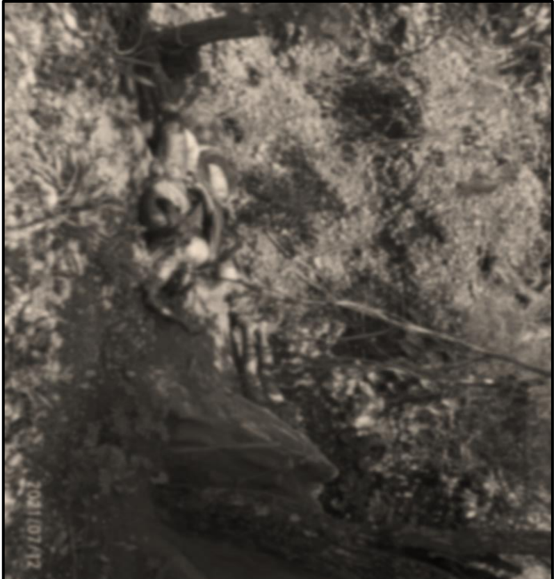
ပုံ (၂-၁) ဒုတိယအကြိမ်ဖြစ်စဉ်

ရုပ်အလောင်းအားလုံးတွင် ပြင်းပြင်းထန်ထန် နှိပ်စက်ညှဉ်းပန်းခံထားရသည့် လက္ခဏာများတွေ့ရပြီး အဆိုးရွားဆုံးမှာ မျက်နှာနှင့် လည်ပင်းများကိုလှီးဖြတ် နှိပ်စက်ညှဉ်းပန်းထားသည့် ဒဏ်ရာများ တွေ့ရှိရခြင်းပင်ဖြစ်သည်။