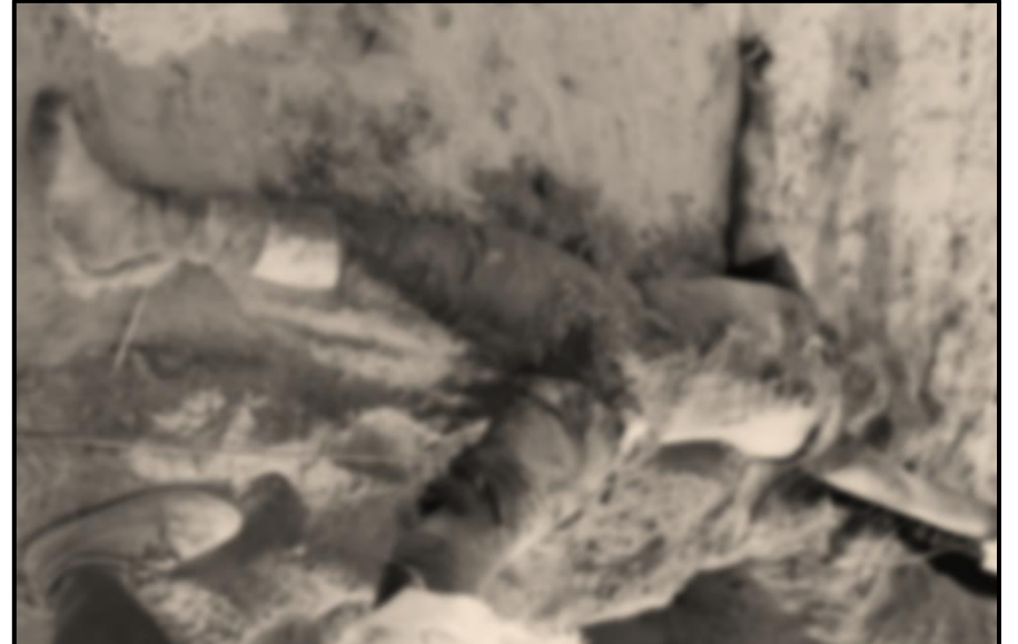
ပုံ (၃-၅) တတိယအကြိမ်ဖြစ်စဉ်