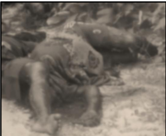
ပုံ (၄-၃) စတုတ္ထအကြိမ်ဖြစ်စဉ်