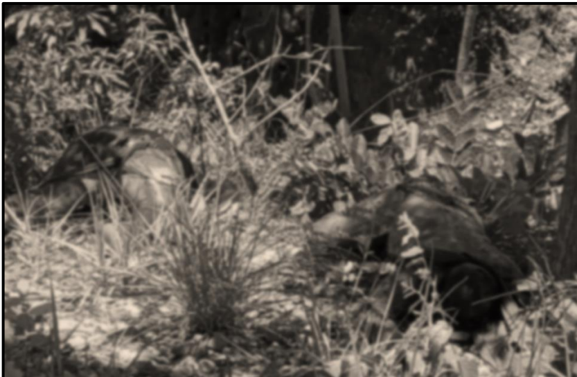
ပုံ (၂-၄) ဒုတိယအကြိမ်ဖြစ်စဉ်