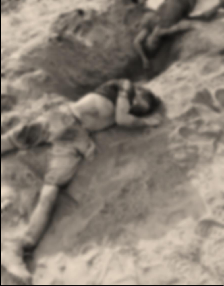
ပုံ (၃-၁) တတိယအကြိမ်ဖြစ်စဉ်

ဇူလိုင်လ (၂၇) ရက်နေ့က ရှာဖွေမှုနှစ်ခုတွင် တွေ့ရှိခဲ့သည့် ရုပ်အလောင်း (၁၂) လောင်းမှာ ဇီးပင်တွင်းရွာမှ (၂) ဦး၊ ချင်းဖုန်းရွာမှ (၁) ဦး၊ သမင်ဇေရွာမှ (၁) ဦး၊ သလောက်ရွာမှ (၁) ဦးနှင့် မုံရွာမှ (၇) ဦး ဖြစ်ကြောင်း သိရသည်။ ရုပ်အလောင်းအားလုံး၏ ခန္ဓာကိုယ်တွင် တူညီသည့်အချက်မှာ ရိုက်နှက်၊ နှိပ်စက်ညှဉ်းပမ်း ခြင်းကြောင့် ဒဏ်ရာအများအပြား ရှိနေခြင်းဖြစ်သည်ဟု ဒေသခံများက ဆိုသည်။