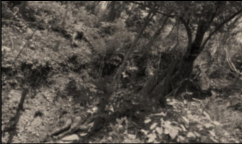
ပုံ (၂-၂) ဒုတိယအကြိမ်ဖြစ်စဉ်