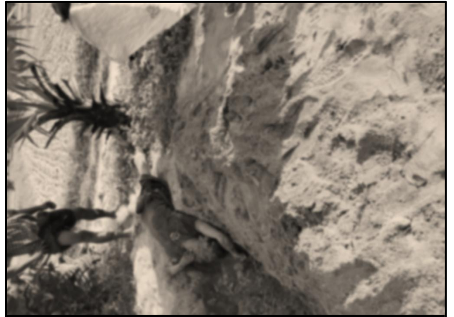
ပုံ (၃-၃) တတိယအကြိမ်ဖြစ်စဉ်