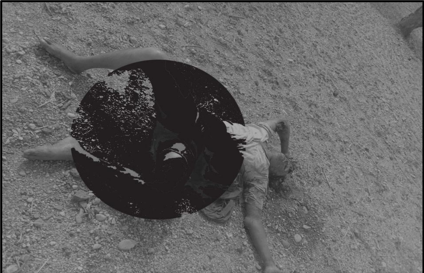
ပုံ (၁-၃) ပထမအကြိမ်ဖြစ်စဉ်