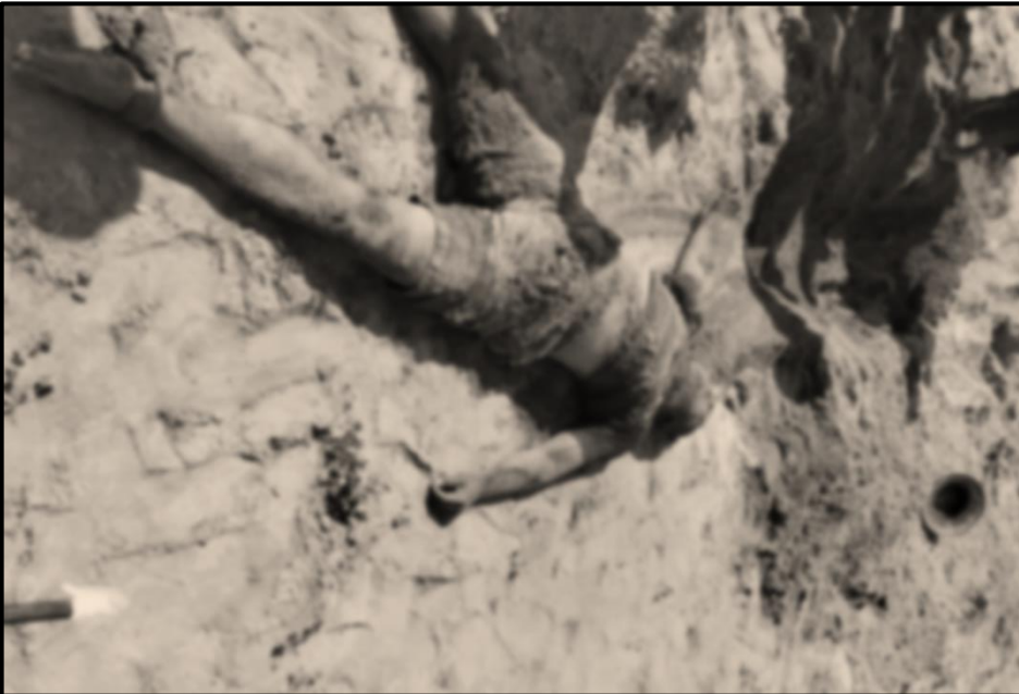
ပုံ (၃-၂) တတိယအကြိမ်ဖြစ်စဉ်