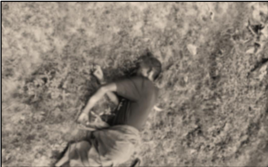
ပုံ (၃-၄) တတိယအကြိမ်ဖြစ်စဉ်