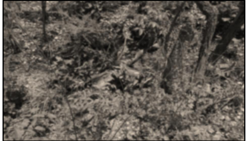
ပုံ (၂-၃) ဒုတိယအကြိမ်ဖြစ်စဉ်