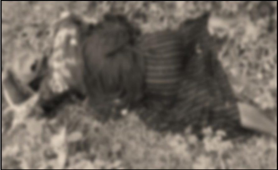
ပုံ (၁-၂) ပထမအကြိမ်ဖြစ်စဉ်