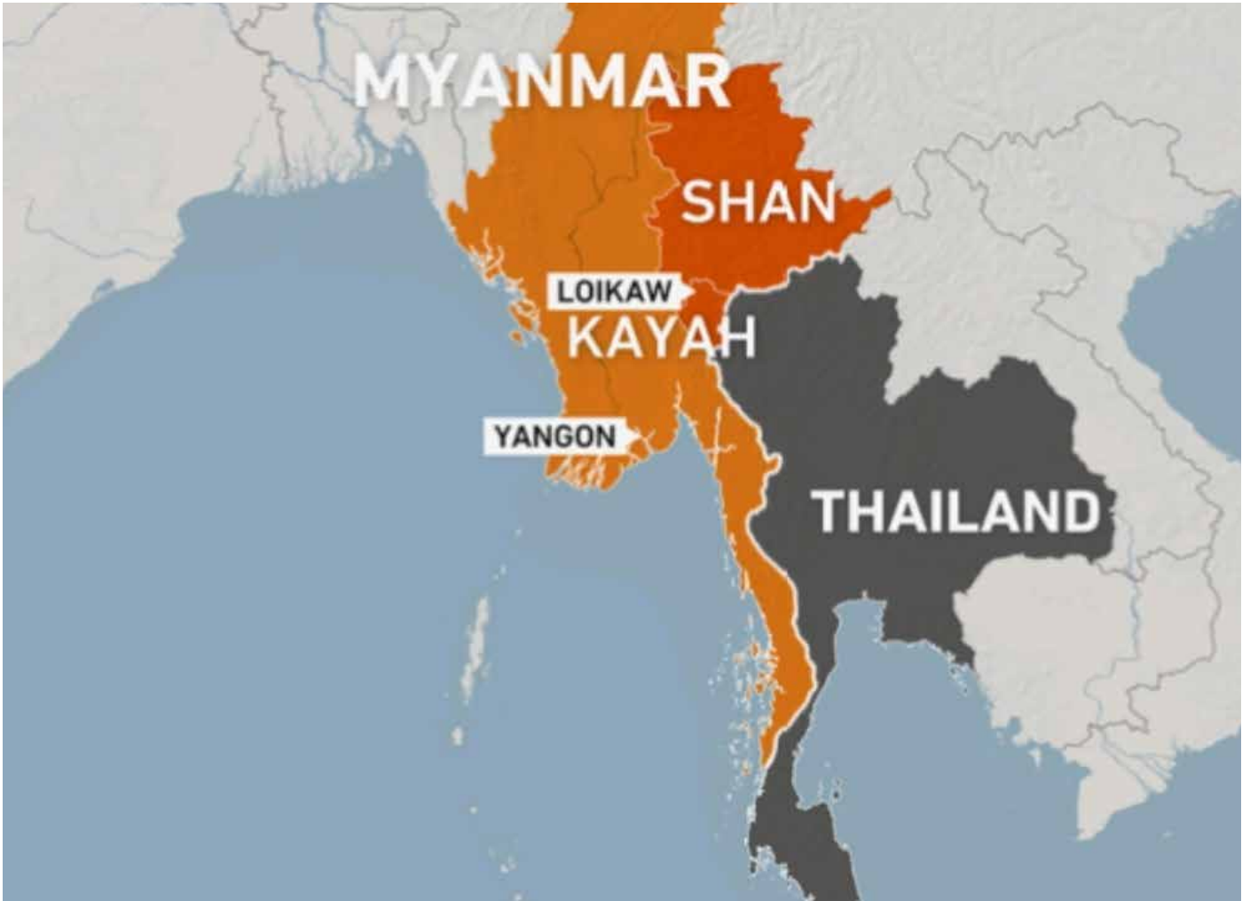
ဓာတ်ပုံ။ လူမရှိသည့် ကျေးရွာများ။ ဒေသခံ ကာကွယ်ရေးတပ်များ မြန်မာပြည်အရှေ့ခြမ်းတွင် အင်အားများပြားလာခြင်း (Al Jazeera, 7 June 2021)

ဒေသခံ PDFs များနှင့် ကရင်နီအမျိုးသားများကာကွယ်ရေးတပ် (KNDF) ပူးပေါင်းတပ်ဖွဲ့များနှင့် စစ်အာဏာ ရှင်တပ်များအကြား တိုက်ပွဲများသည် ၂၀၂၁ ခုနှစ် မေလစ၍ များပြားလာပြီး ၂၀၂၁ ခုနှစ်ကုန်ကားနီးတွင် အခြေအနေမှာ ပို၍ဆိုးရွားလာသည်။ ဒီမောဆိုမြို့နယ်မှာ အထိအနာဆုံးဖြစ်ပြီး လူဦးရေ လေးပုံတပုံမှာ ရွှေ့ပြောင်း ထွက်ပြေးနေရသည်။