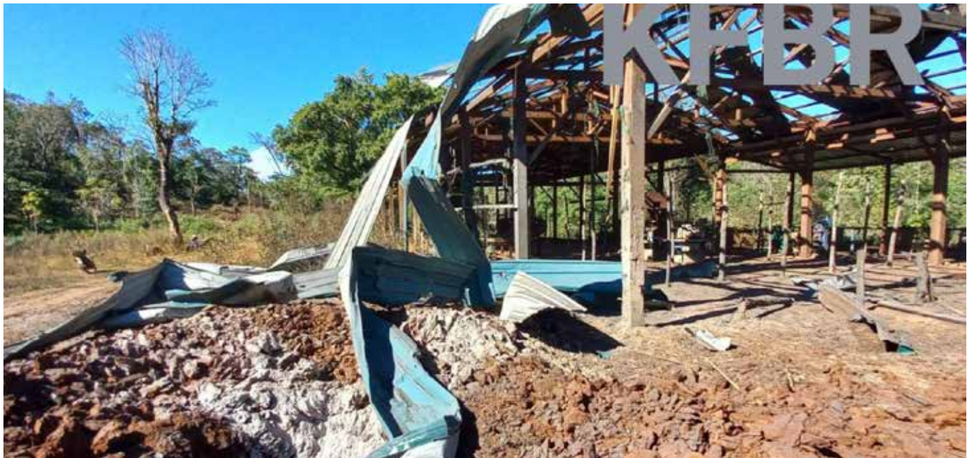
ဓာတ်ပုံ။ ရိုးခီးဘူး အနီးရှိ စစ်ပြေးဒုက္ခသည်စခန်းအနီးအား လေကြောင်းမှတိုက်ခိုက်မှုကြောင့် ပျက်စီးသွားမှု KFBIR (Myanmar Now, 17 January 2022)

ကရင်နီအမျိုးသားများကာကွယ်ရေးတပ် (KNDF), ကရင်နီတပ်မတော်၊ ကရင်နီ ဒီမိုကရက်တစ်တပ်ဦး (KDF) နှင့် ဒေသခံကာကွယ်ရေးတပ်များ စုပေါင်းထားသည့် တပ်များနှင့် မြန်မာ စစ်အာဏာရှင် တို့အကြား ဖြစ်ပွား သည့် တိုက်ပွဲများကြားတွင် ဒေသခံပြည်သူများမှာ ပိတ်မိတတ်ကြသည်။ စစ်အာဏာရှင်တပ်များအား အာဏာသိမ်းမှုဆန့်ကျင်ရေး တပ်များက ခြုံခိုတိုက်ခိုက်အပြီး လွိုင်ကော်တွင် နံနက်စောစော တိုက်ပွဲများ ဖြစ်ပွား ခဲ့သည်။ ၂၅ မိနစ် ၃၀ ကြာတိုက်ပွဲတွင် စစ်အာဏာရှင် တပ်သား ၁၅ ဦး သေဆုံးသည်။ စစ်အာဏာရှင်တပ်များ အား နောက်ထပ် တိုက်ခိုက်မှုမှာ လွိုင်ကော် နည်းပညာတက္ကသိုလ်ရှေ့တွင် ဖြစ်ပွားခဲ့သည်။ ၂၆ စစ်အာဏာရှင် တပ်များက လက်တုန့်ပြန်သည့် အနေဖြင့် လက်နက်ကြီးများပစ်ခတ်၍ အရပ်သား ၂ ဦး ထိခိုက် ဒဏ်ရာရ သွားသည်။ ၂၇