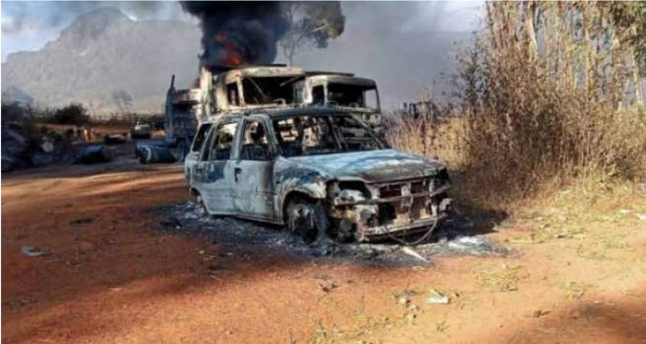
ဓာတ်ပုံ။ ကယားပြည်နယ် ဖရူဆိုမြို့နယ်တွင် တွေ့ရသည့် မီးရှို့ခံထားရသည့် မော်တော်ယာဉ်များ။ ပုံများသည် ကရင်နီအမျိုးသားများကာကွယ်ရေးတပ် (KNDF) မှ ဖြစ်သည် (Handout via AFP)

တစ်သက်နဲ့တစ်ကိုယ် အခုလို အရှင်လတ်လတ်မီးရှို့ သတ်ဖြတ်တာကို မ ကြုံဖူး မကြားဖူးလို့ အခုလို ကိုယ့်ရဲ့ မိသားစုဝင်တွေကိုယ်တိုင် ကြုံတွေ့ လိုက်ရတော့ ကျမမှာ စိတ်ဒဏ်ရာကြီးကြီးမားမားကို ခံစားနေရပါတယ်။ ကလေးတွေအဖေက ကလေးတွေ အရွယ်မရောက်ခင်ကတည်းက ဆုံး သွားလို့ ကျမတစ်ယောက်ထဲ ကျွေးမွေးပြုစု စောင့်ရှောက်ခဲ့ပြီး ကလေး တွေအရွယ်ရောက် အားကိုးရမဲ့အချိန်ရောက်လို့ အခုလို ဘာအပြစ်မှ မရှိဘဲ အရှင်လတ်လတ် မီးရှို့သတ်ဖြတ်ခံရလို့ ပိုပြီး ခံစားနေရတယ်။ တစ်ခါတလေ ရူးကြောင်ကြောင်တောင် ဖြစ်နေပါတယ်။ စိတ်လုံခြုံမှုဆို တာ မရှိတော့ဘူး။ အခု လုံခြုံတဲ့နေရာမှာ နေတာတောင်မှ စိတ်ထဲမှာ မ လုံခြုံတဲ့ ခံစားမှုမျိုးကို အလိုလိုခံစားနေရတယ်။ တရားနဲ့ ဖြေပြီး ကုသနေ ပေမဲ့ စိတ်ဒဏ်ရာကရှိနေဆဲဘဲ”။