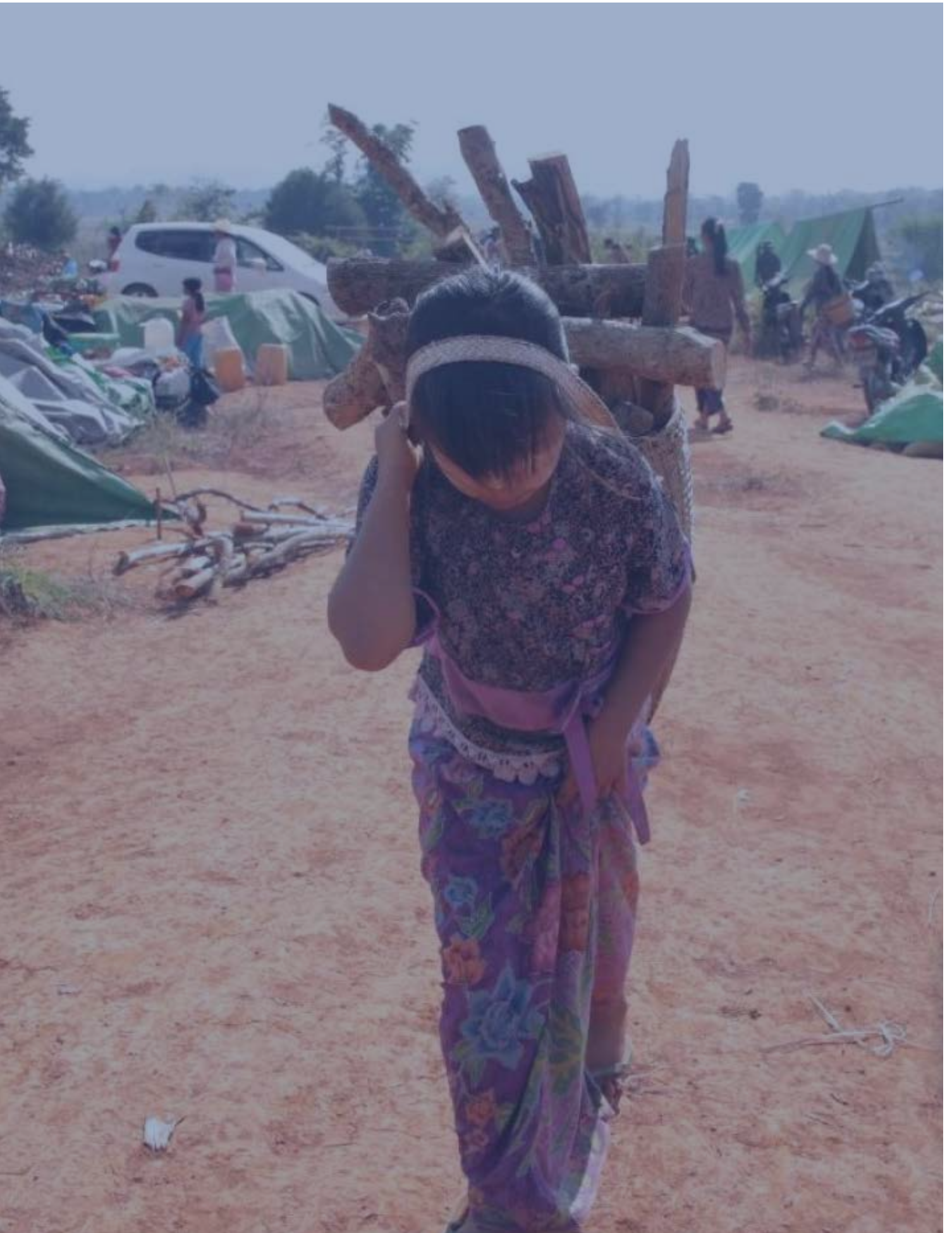
ဓာတ်ပုံ။ ဒီဇင်ဘာ ၂၀ ရက်တွင် တွေ့ရသည့် ဒီမော့ဆိုမြို့နယ်ရှိ စစ်ပြေးဒုက္ခသည်တစ်ဦး