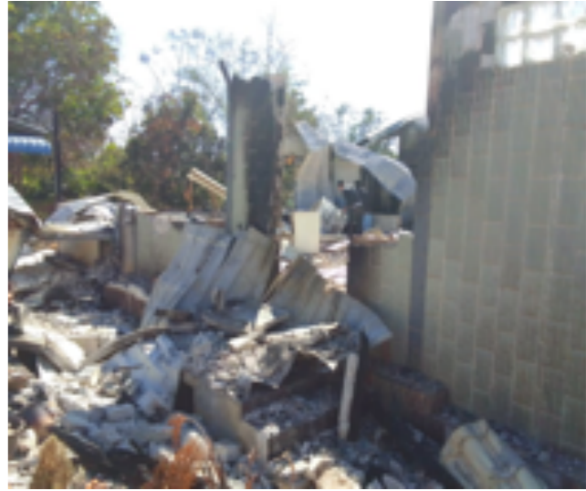
အပေါ်ဆုံးမှ ဓါတ်ပုံ: အမြင့်ပုံဆောက်ထားသည့် မိသားစုအိမ် အောက်ဆုံးမှ ဓါတ်ပုံ: အဆိုပါအိမ်အား စစ်အာဏာရှင်များမှ ဖျက်ဆီးပြီးနောက် တွေ့ရပုံ