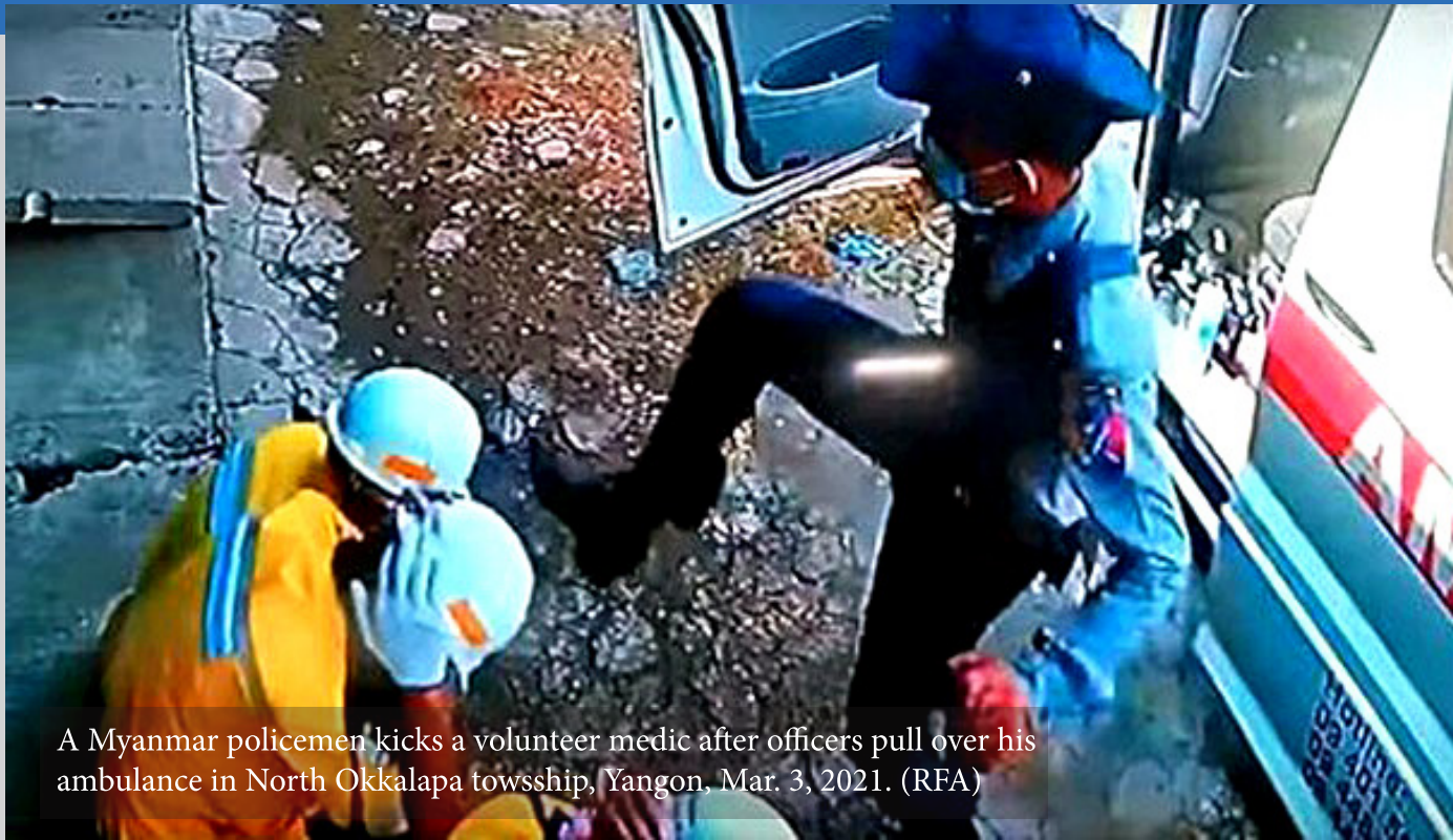
A Myanmar policemen kicks a volunteer medic after officers pull over his ambulance in North Okkalapa towsship, Yangon, Mar. 3, 2021.

သည်။ ၃၄ ရာခိုင်နှုန်းမှာ တယ်လီဖုန်း သို့မဟုတ် ဆိုရှယ်လူမှုကွန်ရက်များမှ တဆင့် ကျန်းမာရေး အကူအညီများ ရရှိကြပြီး ကိုဗစ်-၁၉ ကပ်ရောဂါကြောင့် သေဆုံးသူ သုံးပုံ နှစ်ပုံသော လူထုမှာ မည်သည့် ကျန်းမာရေးစောင့်ရှောက်မှု တစ်စုံတရာမျှ မရရှိကြပေ။ ၎င်းတို့အထဲမှာ ၇၃ ရာခိုင်နှုန်းမှာ အိမ်တွင် သေဆုံးကြသူများဖြစ်ပြီး ၁၇ ရာခိုင်နှုန်းမှာ အစိုးရ ဆေးရုံများတွင် သေဆုံးကြသူများဖြစ်သည်။ ထိရောက်စွာ ကိုင်တွယ်ခြင်းမရှိသည့်အတွက် ကိုဗစ်-၁၉ကြောင့် နေ့စဉ်သေဆုံးသူနှင့် ကူးစက်သူ အရေအတွက် များပြားလာသည်။ နေအိမ်များတွင် အသည်းအသန် အကူအညီလိုအပ်သူများကို ကူညီကုသပေးသည့် ကျန်းမာရေး လုပ်သားများမှာ စစ်အာဏာရှင်တို့၏ အမနာပ ပြောဆိုခြင်းခံရသည်။ ဖေဖော်ဝါရီ ၁၁ မှ မေလ ၁၁ အတွင်း တိုက်ခိုက်ခံရသည့် ကျန်းမာရေးလုပ်သားများအကြောင်းကို Physicians for