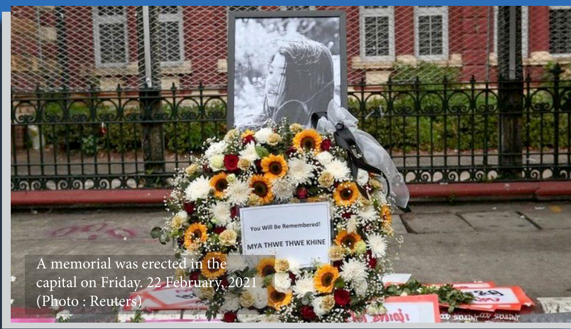
A memorial was erected in the capital on Friday, 22 February, 2021

အပြင်းအထန် နှိပ်ကွပ်နေသည့် ကာလများတွင် နယ်ပယ်အသီးသီးမှ ခေါင်းဆောင်များသည် မတရားမှုကို ရင်ဆိုင်တုန့်ပြန်ကြသည်။ ကချင်ပြည်နယ် မြစ်ကြီးနားမှ ကက်သိုလစ် သီလရှင်တပါးသည် တဦးအပါအဝင် ဖြစ်ပြီး စစ်သားနှင့် ရဲများကို ဆန္ဒပြသူများအား ပစ်ခတ်ခြင်းမပြုရန် မတ္တောရပ်ခံခဲ့သည်။ သို့သော်လည်းစစ်အာဏာရှင်တို့မှာ ၎င်းတို့၏ အကြမ်းဖက်မှုကို မရပ်တန့်ခဲ့ပေ။ မတ်လ ၃၁ ရက်နေ့က ရန်ကုန်တွင် လူ ၁၃ဦး သေဆုံးခဲ့သည့် ဖြိုခွင်းမှုက အာဏာသိမ်းချိန်မှစပြီး သွေး ထွက်သံယို အများဆုံးနေ့ထဲမှ တနေ့ဖြစ်သည်။ အကျဉ်းကျနေသည့် နိုင်ငံရေး အကျဉ်းသားများကလည်း စစ်အာဏာရှင်တို့၏ မတရားမှုကို ရပ်တန့်ရန် တောင်းဆိုကြသည်။ အကြမ်းဖက်ဖြိုခွင်းမှုများ ရှိနေသော်လည်း ဆန္ဒပြသူများအား မဟန့်တားနိုင်ဘဲ ပိုစတာများ၊ ကြွေးကြော်သံများဖြင့် ရဲဝံ့စွာ လမ်းမများပေါ်