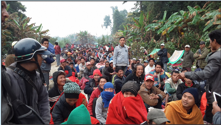
ပယင်းမှော်တွင် ပိတ်မိနေစဉ် လမ်းဖွင့်ဖို့စောင့်နေကြသော ပြည်သူများ (ခါတ်ပုံ KWAT)

ရွာသားများအား မြန်မာစစ်တပ်မှ ပုံးကြဲတိုက်ခိုက်ပြီးနောက် ရွာသား ၅ ဦး ဒဏ်ရာရရှိသွားသည်။ မိသားစုဝင်အချို့ တနိုင်းရှိ ပယင်းမှော်တွင် သွားရောက် အလုပ်လုပ်စဉ် ကျန်ရစ်သူများက သစ်သားအိမ်အတွင်း နေထိုင်ကြစဉ် တိုက်ခိုက်ခံရခြင်းဖြစ်သည်။ တိုက်ခိုက်ခံရသူများမှာ အသက် ၁၈ နှစ်နှင့် ၃၁ နှစ် ရှိ ညီအမနှစ်ဦး၊ အသက် ၁၈ နှစ် လူငယ်တဦးနှင့် ကလေးနှစ်ဦး တို့ဖြစ်သည်။ ၎င်းတို့မှာ တွေ့ဆုံမေးမြန်းမှု ပြုနေစဉ်အတွင်း ရွာမှ ၄ နာရီခန့်ဝေးသည့် ဆေးခန်းတွင် ဆေးကုသမှု ခံယူနေရသည်။