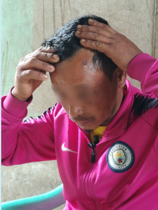
မြန်မာစစ်တပ်၏ ညှဉ်းပန်းနှိပ်စက်ခြင်းကို ခံခဲ့ရသော ကချင်တိုင်းရင်းသားတစ်ဦး

အဆိုပါရွာသားက သူသည်တောထဲတွင်နေသူဖြစ်၍ သူ့အိမ်သို့ KIA စစ်သားများ တစ်ခါတရံ လာရောက်ကြ သည်ဟုပြောသည်။ သူ့ကိုညဘက်တွင်ချုပ်နှောင်ထားပြီး ရေနံစားစရာလည်း မပေးချေ။