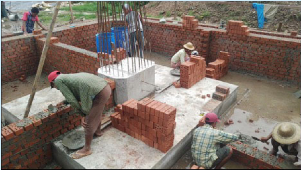
ဓာတ်ပုံ။ ရှစ်လေးလုံးအထိမ်းအမှတ်ကျောက်တိုင် စတင်တည်ဆောက်နေပုံ (ဓာတ်ပုံ၊ ဒီမိုကရေစီလှုပ်ရှားမှုကော် မတီ၊ ပဲခူး)

အစီရင်ခံသည့်ကာလအတွင်း လူ့အခွင့်အရေးချိုးဖောက်ခံရသူများအတွက် အစိုးရအနေဖြင့် အဓိပ္ပာယ်ပြည့်ဝသည့် ပြန်လည်ကုစားပေးလျော်မှု တစ်စုံတရာဆောင်ရွက်ပေးခြင်းမရှိပေ။ တိုင်းပြည်တွင်းရှိ အရပ်ဖက်အဖွဲ့အစည်းများကသာ (အစိုးရကိုယ်စား) နှစ်နာသူများအား ဆက်လက်ကူညီထောက်ပံ့နေသည်ကို တွေ့ရသည်။ ဖေဖော်ဝါရီလက ရန်ကုန်မြို့တွင် နိုင်ငံရေးအကျဉ်းသားဟောင်းများအတွက် အခမဲ့ကျန်းမာရေး စောင့်ရှောက်မှုပေးရန် တက်ကြွလှုပ်ရှားသူများနှင့် နိုင်ငံရေးအကျဉ်းသားဟောင်းများက ဖွင့်လှစ်ခဲ့သည်။ အစီရင်ခံစာရေးသားနေသည့်အချိန်တွင် ရှစ်လေးလုံးအထိမ်းအမှတ် ကျောက်တိုင် စိုက်ထူရန်အတွက် ပဲခူးတွင်ဆောင်ရွက်နေသည်။