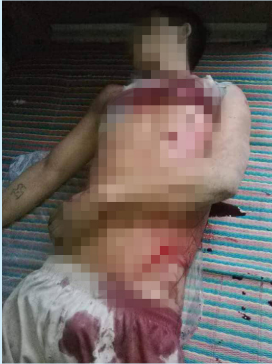
အောင်လွတ်တွင် ဗမာ့တပ်မတော် လေယာဉ်မှ လက်နက်ကြီးပစ်ချသောကြောင့်သေဆုံးသွားသူ အသက် (၂၁) ရှိ ကချင်တိုင်းရင်းသားတစ်ဦး

တိုက်ပွဲကြားမှ ထွက်ပြေးလာသူ အသက် ၅၇ နှစ်ရှိ ကချင် အမျိုးသားတဦးအား ND-Burma မှ တွေ့ဆုံမေးမြန်းရာ တိုက်လေယာဉ်များသည် သတိပေးမှု တစ်ခုတရားမလုပ်ပဲ ရွာအတွင်းသို့ ဝင်ကြပြီး သေနတ်ဖြင့်ပစ်ခတ်တိုက်ခိုက်ခဲ့ သည်။ ၁၃ ရွာသားများကို ရည်ရွယ်ချက်ရှိရှိ ပစ်မှတ်ထား တိုက်ခိုက်ခြင်းဖြင့် KIA စစ်သားများ ထွက်လာမည်ဟု ၎င်း ကပြောသည်။