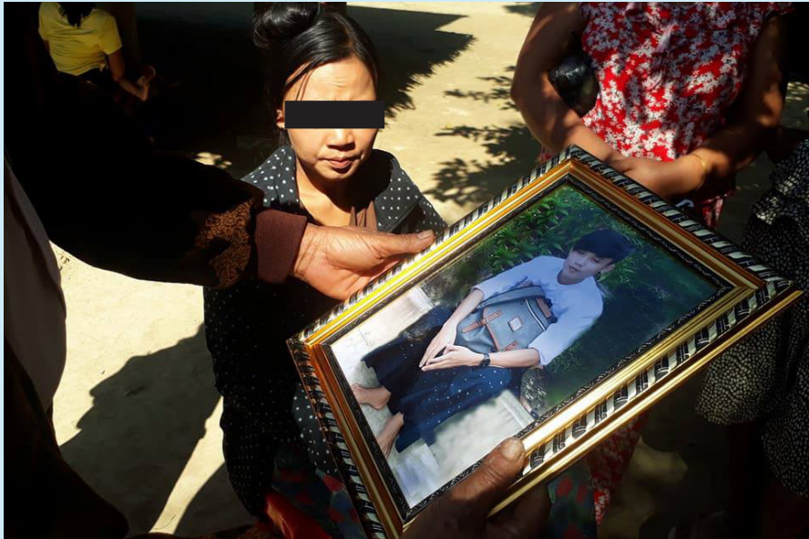
ရဲတပ်ဖွဲ့၏ ပစ်ခတ်မှုကြောင့် သေဆုံးသွားသူ အသက်(၁၈) နှစ်ရှိ တိုင်းရင်းသားတစ်ဦး

ရခိုင်ဘုရင့်နိုင်ငံတော်ကျဆုံးခြင်း အထိမ်းအမှတ် နှစ်ပတ်လည်အခမ်းအနားကျင်းပရန် တောင်းဆိုဆန္ဒပြ ပွဲတွင်ပါဝင်ခဲ့သည့် အသက် ၂၃ နှစ်အရွယ် ရခိုင်အမျိုးသားတဦးအား ရဲက ညှဉ်းပန်းနှိပ်စက်ရာ သေဆုံးသွားသည်။ လူပေါင်း ၄၀၀၀ ခန့် အစိုးရအဆောက်အဦးကို စီတန်းလှည့်လည်ပြီး နှစ်ပတ်လည် အထိမ်းအမှတ်အခမ်းအနား ကျင်းပခွင့်ပေးရန် တောင်းဆိုဆန္ဒပြကြရာ ရဲတပ်ဖွဲ့က လူအုပ်ထဲသို့ သေနတ်ဖြင့်ပတ်ခတ်ခဲ့သည်။ သေဆုံး သွားသူမှာ ရဲစခန်းသို့ ဖမ်းဆီးခြင်းခံရပြီး သေဆုံးသည်အထိ ထိုးကြိတ်ခြင်းခံရသည်။ ရဲများက သူ့ရုပ် အလောင်းကို နောက်နေ့တွင် ဆေးရုံသို့ ပို့ဆောင်ခဲ့သည်။ ရဲတပ်ဖွဲ့ကြောင့် လူ ၇ ဦး သေဆုံးပြီး နောက်ထပ် ၁၂ ဦး ဒဏ်ရာရခဲ့သည်။