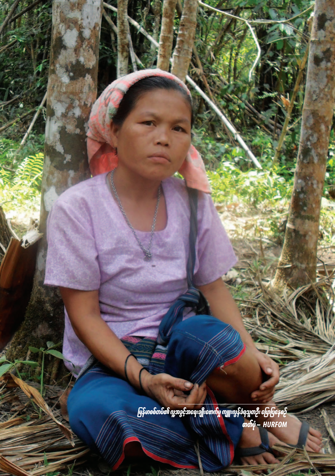
မြန်မာစစ်တပ်၏ လူ့အခွင့်အရေးချိုးဖောက်မှု ကျူးလွန်ခံရသူတိုင်း ပြောပြနေတဲ့ ဓာတ်ပုံ