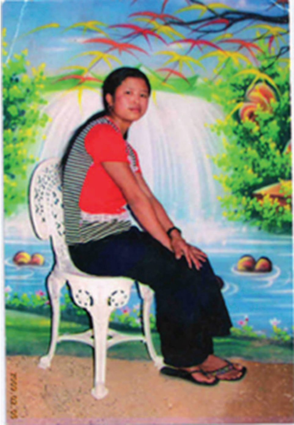
မြန်မာစစ်တပ်၏ အသက်ခံရသော ဆွမ်းလွတ်ရွယ်ဂျာ ဇာတ်ပုံ - KWAT