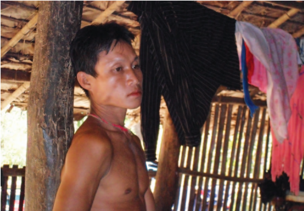
မျှော်လင့်ချက်မဲ့သော ၅၀ - မြန်မာစစ်တပ်၏ အမျိုးမျိုးသော လူ့အခွင့်အရေးချိုးဖောက်မှုများကို ပြန်ပြောင်းပြောပြနေစဉ်