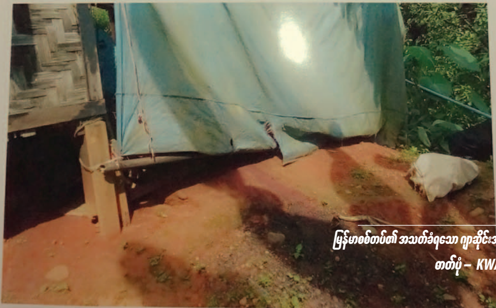
မြန်မာစစ်တပ်၏ အသတ်ခံရသော ဂျာဆိုင်းအိန်

မဂျာဆိုင်းအိန်အားသေနတ်ဖြင့် ပစ်သတ်ခဲ့သော အခင်းဖြစ်သွားရာနေရာ