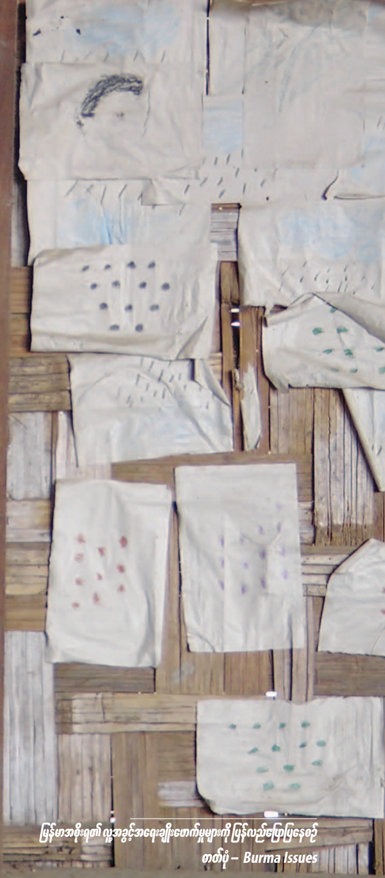
မြန်မာအစိုးရ၏ လူ့အခွင့်အရေးချိုးဖောက်မှုများကို ပြန်လည်ပြောပြနေစဉ်