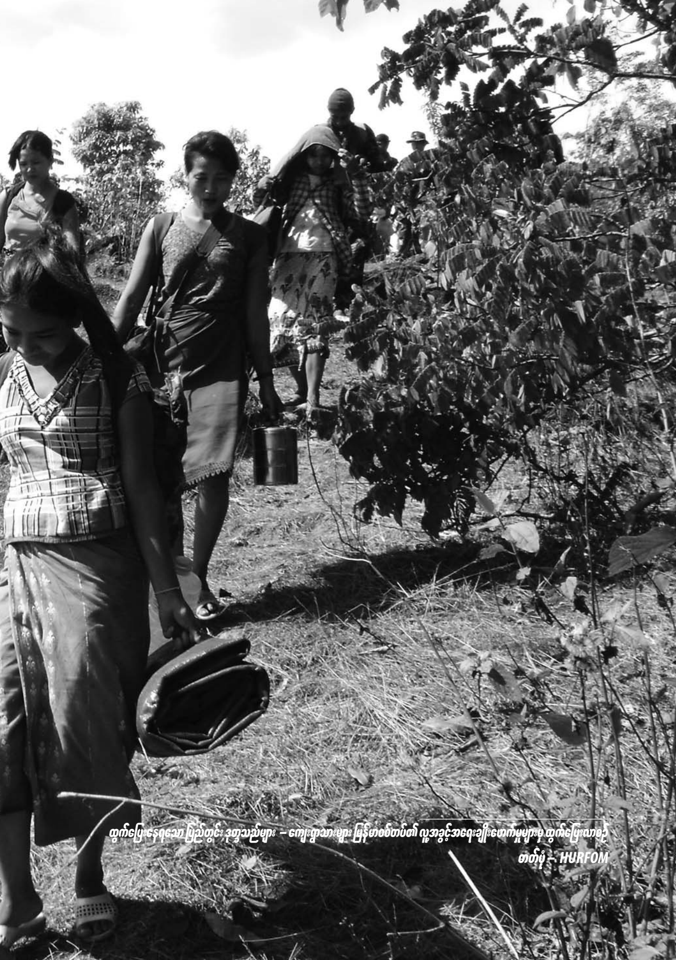
ထွက်ပြေးနေရသော ပြည်တွင်း ဒုက္ခသည်များ - ကျေးရွာသားများ မြန်မာစစ်တပ်၏ လူ့အခွင့်အရေးချိုးဖောက်မှုများမှ ထွက်ပြေးလာစဉ်