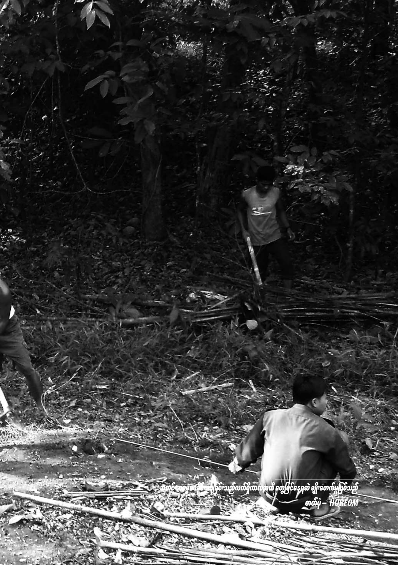
အတင်ဆေးစစ်ခိုင်းစိုင်းခြင်းသည်လက်ရှိကာလအထိ တွေ့မြင်နေရဆဲ ချိုးဖောက်မှုဖြစ်သည်