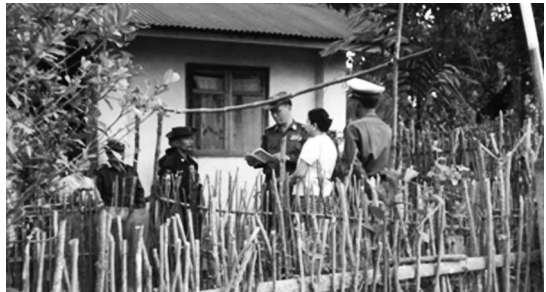
မွန်ပြည်နယ်တွင် စစ်တပ်အရာရှိများမှ ဒေသခံများအား ကြံ့ဖွံ့ပါတီအား မဲပေးရန် ခြိမ်းခြောက်နေပုံ။ စစ်အစိုးရနှင့် ၎င်း၏ လက်ဝေခံကြံ့ဖွံ့ပါတီတို့မှ ကြံ့ဖွံ့ပါတီအနိုင်ရရှိရေး သေချာစေရန်အတွက် နည်းမျိုးစုံသုံးရင်း ပြည်သူများအပေါ် လူ့အခွင့်အရေးချိုးဖောက်မှုပေါင်းများစွာ ကျူးလွန်ခဲ့ကြပါသည်။

စစ်အစိုးရ၏ တပ်မ (၂၂) လက်အောက်ခံတပ်ရင်းတရင်းမှ ကရင်ပြည်နယ် မြဝတီမြို့နယ် သဲဖာထောရွာတွင် နေထိုင်သော ရွာသူရွာသားများအား ရွေးကောက်ပွဲတွင်သွားရောက်မဲပေးရန် အတွက်အမိန့် ပေးခဲ့ပါသည်။ သို့သော် နိုဝင်ဘာလ ၇ ရက်နေ့တွင်ပြုလုပ်ခဲ့သော ရွေးကောက်ပွဲတွင် ၎င်းရွာသူရွာသားများမှ မဲသွားမပေးခဲ့သောကြောင့် ထိုနေ့ညနေခင်းအချိန်တွင် ထိုတပ်မ (၂၂) လက်အောက်ခံတပ်ရင်းမှ သဲဖာထောရွာအား ဝင်ရောက် မီးရှို့ဖျက်ဆီးခဲ့ပါသည်။ ၁၀၂ ထိုအဖြစ်အပျက်သည် မြန်မာနိုင်ငံတွင် ရွေးကောက်ပွဲပြီး နောက်ပိုင်းဖြစ်ပွားသော လူ့အခွင့်အရေး ချိုးဖောက်မှုများနှင့် အကြမ်းဖက်မှုများ၏ ရှေ့ပြေးဟုလည်း သတ်မှတ်နိုင်ပါသည်။