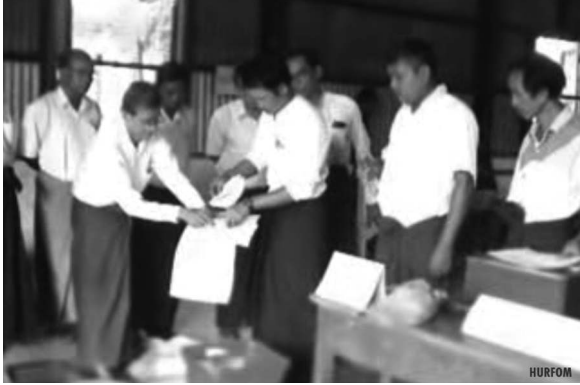
မဲရုံပိတ်ပြီးနောက် မဲရုံတာဝန်ရှိသူများမှ ကြိုတင်မဲများပေါင်းထည့်၊ မွန်ပြည်နယ်