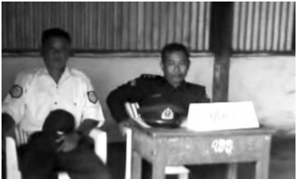
ဒေသဆိုင်ရာ အာဏာပိုင်များမှ မဲဆန္ဒရှင်များအား ကြံ့ဖွံ့ပါတီအား မဲပေးခိုင်း၊ မွန်ပြည်နယ်

မိုးပူကျေးရွာများတွင် ကြံ့ဖွံ့ပါတီ စည်းရုံးရေးမှူးတစ်ဦးမှ မဲပြား ၅၀၀ အားလိုအပ်လျှင် ကြံ့ဖွံ့ပါတီ အတွက် အသုံးပြုရန် သိမ်းထားကြောင်း ဒေသခံတစ်ဦးမှ ပြန်ပြောပြပါသည်။ ထိုစည်းရုံးရေးမှူး မှ ပင် ကလေးသူငယ်များအား အတင်းအကျပ်ပြုကာ ၎င်းအတွက် မဲပေးခိုင်းသည့်အပြင် အချို့မဲဆန္ဒရှင်များအား ၎င်းအတွက် မဲကိုအထပ်ထပ် ပေးခိုင်းခဲ့ပါသည်။ ၆၀ ရှမ်းပြည်နယ်နမ့်ခမ်းမြို့နယ် အောင်မေတ္တာရပ်ကွက် မဲရုံအမှတ် ၂ တွင်ကိုယ်စားလှယ်လောင်း တစ်ဦးမှ လူပေါင်း ၁၅၀ အား တစ်ဦးလျှင် ၇၅၀၀ ကျပ်နှုံးပေးကာ ၎င်းအားမဲ