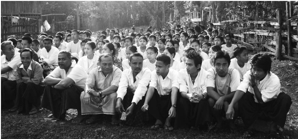
ကြံ့ဖွံ့ပါတီဝင်များ စုရုံးနေစဉ်၊ မွန်ပြည်နယ် ကျိုက်မရောမြို့နယ်၊ ၂၀၁၀ ခုနှစ် ဇူလိုင်လ

ရန်ကုန်တိုင်း၊ ကြည့်မြင်တိုင်မြို့နယ် ကျည်စုအရှေ့ရွာတွင် မဲစာရင်းကောက်ရာ၌ ဥက္ကဋ္ဌမှ လယ် သမားများအား ‘ခင်ဗျားတို့ကြံ့ဖွံ့ပါတီကို မဲထည့်ရမယ်။ မဲထည့်ရင် ခင်ဗျားတို့ လယ်ကို အရင် နှစ် ၂၀၀၉ ခုနှစ်က လယ်ဧက (၆၀၀၀) သိမ်းလိုက်တာခင်ဗျားတို့ အသိ။ ဒါကြောင့် ၂၀၁၀ ရွေးကောက်ပွဲမှာ ကြံ့ဖွံ့ပါတီကို မဲထည့်ရမယ်။ မထည့်ရင် ခင်ဗျားတို့ လယ်ဧက (၄၀၀၀) ကျော် ကို ထပ်သိမ်းရမယ်လို့ ရန်ကုန်တိုင်း စစ်ဌာနချုပ်တိုင်းမှူး ဗိုလ်ချုပ်ဝင်းမြင့်က အမိန့်ပေးထား တယ်’ ဟု တောင်သူလယ်သမားများအား ခြိမ်းခြောက် ပြောကြားပါသည်။ ၂၈