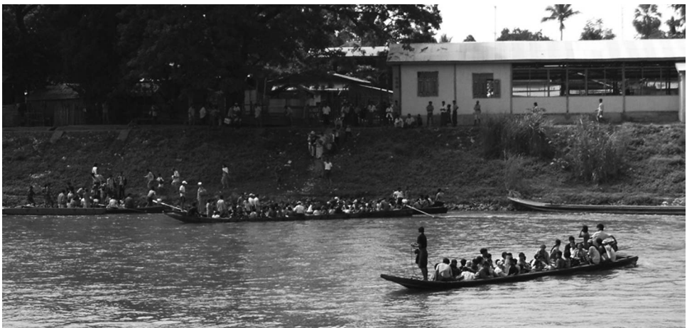
ရွေးကောက်ပွဲပြီးပြီးချင်းဖြစ်ပွားသည့် တိုက်ပွဲများကြောင့် ဒေသခံပြည်သူများ ဘေးလွတ်ရာထွက်ပြေးရ စဉ်၊ ၂၀၁၀ ခုနှစ် နိုဝင်ဘာလ ၈ ရက်