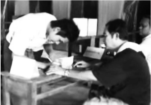
မဲရုံတာဝန်ရှိသူတစ်ဦးမှ မဲဆန္ဒရှင်များအား ကြံ့ခိုင်ရေးပါတီအား မဲပေးခိုင်း