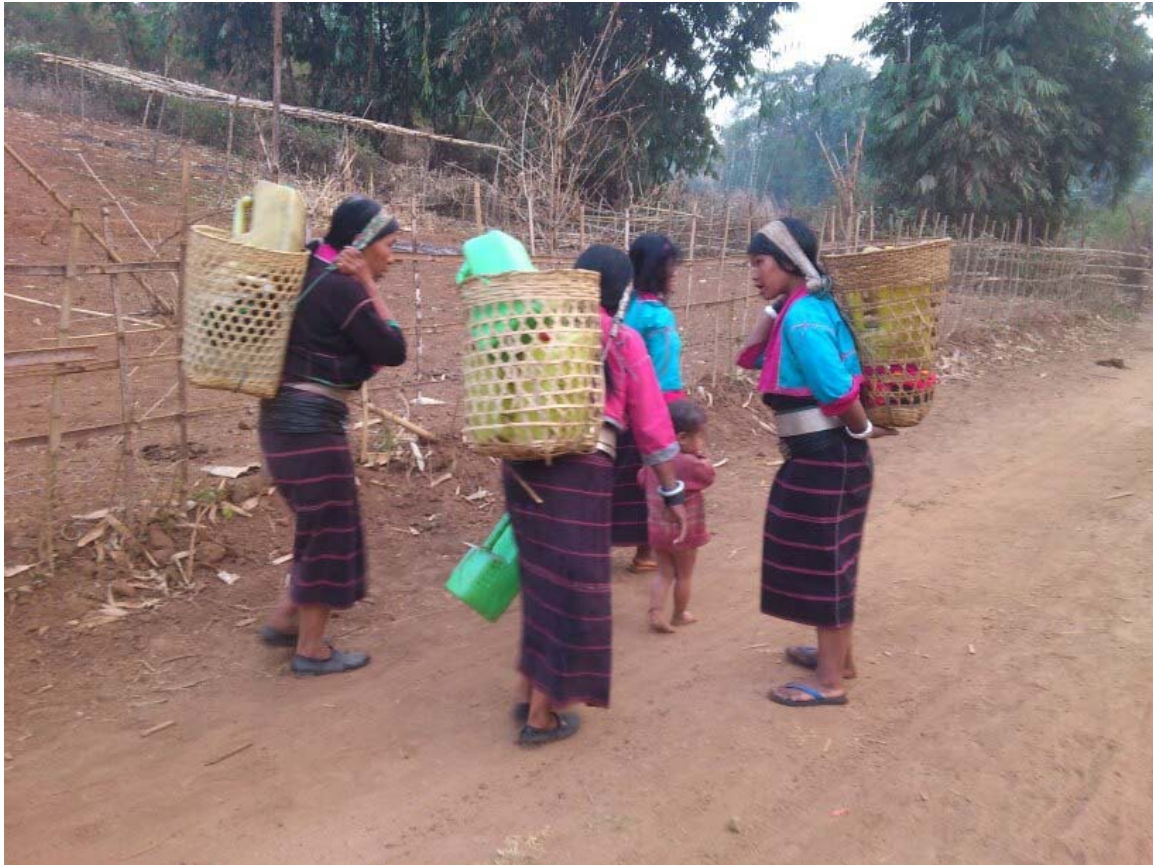
ဒေသခံပလောင်တိုင်းရင်းသားများ စစ်ဒဏ်ကြောင့် ရွှေ့ပြောင်းနေရပုံ။

အဆိုပါ လှုပ်ရှားမှုများမှာ အတိတ်နှင့်ပတ်သက်ပြီး အမှန်တရားနှင့် တရားမျှတမှု ရှာဖွေရန်နှင့် အမျိုး သားပြန်လည် ရင်ကြားစေမှုများ ရရှိလာစေရန် လမ်းကြောင်းမှန်ပေါ်သို့ စတင်ရောက်ရှိ လာခြင်းလည်း ဖြစ်သည်။ ထို့ကြောင့် ကွန်ရက် (ND-Burma) အနေဖြင့် လူ့အခွင့်အရေးချိုးဖောက်မှုများကို မှတ်တမ်းတင်၍ အစီရင်ခံစာများထုတ်ပြန်သည့် အမှန်တရားဖော်ထုတ်ခြင်း လုပ်ငန်းများကို ဆက်လက်ဆောင်ရွက်ပြီး မြန်မာနိုင်ငံတွင် တရားမျှတမှု ပြန်လည်ရရှိစေရန်အတွက် ကြိုးပမ်းမည်ဖြစ်သည်။