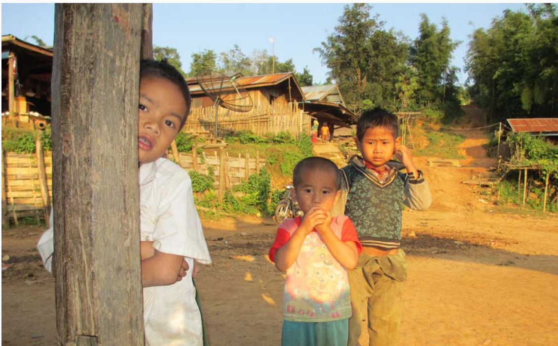
ပလောင်ဒေသရှိ ကလေးငယ်များ ပညာသင်ကြားခွင့် ဆုံးရှုံးနေပုံ။