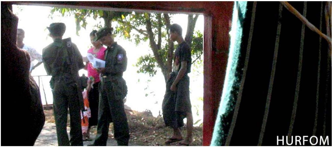
မွန်ပြည်နယ်အတွင်း စစ်တပ်မှ ဒေသခံပြည်သူများအား မည်သည့်အကြောင်းပြချက်မျှ မရှိဘဲ စစ်ဆေးနေပုံ