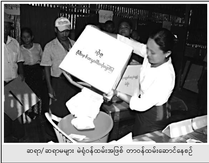
ဆရာ/ဆရာမများ မဲရုံဝန်ထမ်းအဖြစ် တာဝန်ထမ်းဆောင်နေစဉ်

အကူအဖြစ်လည်းကောင်း အလုပ်ခိုင်းစေခဲ့ပါသည်။ စည်းရုံးရေးခရီးစဉ် သုံးရက် လေးရက်လောက် အတွင်း ရွာသားများမှာ မိမိစရိတ်ဖြင့် မိမိလိုက် ရသည့်အပြင် လမ်းခရီး၌ ဖျားနာခြင်းများရှိလာခဲ့ရာ ဆေးကုသမှုလည်း မရခဲ့ကြပေ။ အပြန်တွင်လည်း မိမိစရိတ်ဖြင့်ပင် ပြန်ခဲ့ကြရသည်။ ၃၅