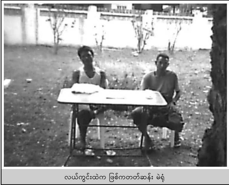
လယ်ကွင်းထဲက ဖြစ်ကတတ်ဆန်း မဲရုံ

မြန်မာနိုင်ငံကို ကြီးကြီးမားမား ထိခိုက်နစ်နာစေခဲ့သည့် နာဂစ်မုန်တိုင်းတိုက်ခတ်ပြီး တစ်ပတ်သာ ကြာမြင့်သေးသည့် အချိန် ၂၀၀၈ ခုနှစ် မေလ ၁၀ ရက် နေ့တွင် စစ်အစိုးရမှ ၂၀၀၈ ဖွဲ့စည်းပုံအခြေခံဥပဒေကို အတည်ပြုရန် လူထုဆန္ဒခံယူပွဲ ပြုလုပ်ခဲ့သည်။ ထိုဆန္ဒခံယူပွဲမှာလည်း လူ့အခွင့်အရေး ချိုးဖောက်မှုများနှင့် ပြည့်နှက်နေသည် တွေ့ရှိပေသည်။ အစိုးရက ဆန္ဒမဲများအား အတင်းအကျပ် ကြိုတင်ကောက်ခံခဲ့ပြီး၊ ဝန်ထမ်းများ၊ စစ်မှုထမ်းများက ကြိုတင်မဲ (ထောက်ခံသောမဲ) များ ထည့်ခဲ့ရသည့် မှတ်တမ်းများ အများအပြား ရှိခဲ့သည်။ နာဂစ်မုန်တိုင်းအပြီး မုန်တိုင်းဒုက္ခသည်များအား အစိုးရက ဖွဲ့စည်းပုံအခြေခံဥပဒေအား ထောက်ခံသည့် မဲများ အတင်းအကျပ် ဆန္ဒပြုစေခဲ့သည်။ မုန်တိုင်းအတွင်း သေဆုံး၊ ပျောက်ဆုံးသွားသူများ၏ လက်မှတ်များပါ ပါဝင်နေခြင်းမှာ အကျဉ်းတန်လွန်းသော သာဓကများ ပင်ဖြစ်နေခဲ့သည်။ ဆန္ဒပြုရမည့် ရက်မတိုင်မှီကပင် သေဆုံး၊ ပျောက်ဆုံးသွားသူများသည် ဖွဲ့စည်းပုံအခြေခံဥပဒေအား ထောက်ခံကြောင်း ကြိုတင်မဲပေးပြီး ဖြစ်နေခဲ့သည်။